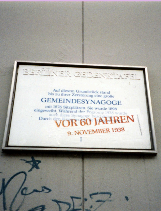
9. November 1998

Ausgangspunkt für eure Interventionen sind die Berliner Gedenktafeln aus Porzellan sowie die vereinseigenen Gedenktafeln.