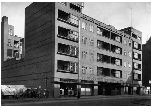
„Verbandshaus der deutschen Buchdrucker, Baumeister: Max Taut, Berlin, Am Hohenzollernkorso“ 1926, Foto: Paul W. John

Schon vor der Eingemeindung 1861 war es als Ausflugsziel beliebt, neben Militärparaden lockten Lokale in den Weinbergen die Besucher. Und diese waren auch schon früher aufmüßig, trafen sich doch hier patriotische Turnfreunde wie Jahn und Friesen, um den Widerstand gegen Napoleon zu organisieren. So lebten auch während der Zeit des Nationalsozialismus Menschen im Kiez, die aus unterschiedlichen Gründen Opfer der Gewaltherrschaft wurden. An einige von ihnen soll bei diesem Rundgang erinnert werden.