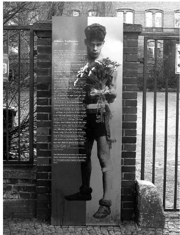
Gedenkstele für Johann „Rukeli“ Trollmann vor der nach ihm benannten Sporthalle an der Bergmannstraße 28 (siehe auch Seite 8, linke Spalte unten)

2 An dieser Stelle befand sich der Eingang zum Sommergarten der Berliner Bockbrauerei. Hier gewann am 9. Juni 1933 der Sinto Johann „Rukeli“ Trollmann den deutschen Meisterschaftskampf im Boxen. Wenige Tage später wurde ihm der Titel wegen seines tänzelnden, „undeutschen“ Kampfstils aberkannt. Am 21. Juli 1933 wurde ein weiterer Kampf gegen Gustav Eder angesetzt mit der Auflage, nach „deutscher Art“ zu boxen. Aus Protest färbte sich Trollmann die Haare blond und bestäubte seinen Körper weiß mit Mehl. Seines erfolgreichen Stils beraubt, verlor er den Kampf – es war das Ende seiner