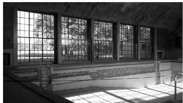
Blick in die Schwimmhalle auf dem Gelände des ehemaligen Olympischen Dorfes von 1936 bei Döberitz-Elstal