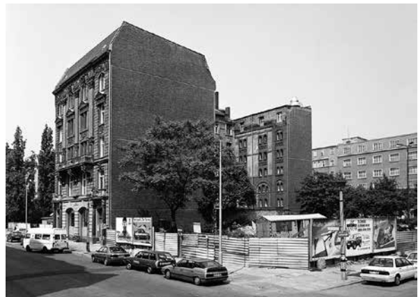
Die Französische Straße 47 in Mitte, von der Ecke Charlottenstraße aus gesehen, am 3. Juni 1993

Ob die Kanzlei Ebers jüdisch war oder nicht, konnte ich nicht feststellen. Im Adressbuch von 1936 jedenfalls fehlt der Eintrag, stattdessen taucht der Name „Enit-Delegation“ auf, das staatliche italienische Reiseverkehrsamt. 1940 nutzten ein Steuerberater sowie das Institut für Wohnungs- und Siedlungswesen die Etage.