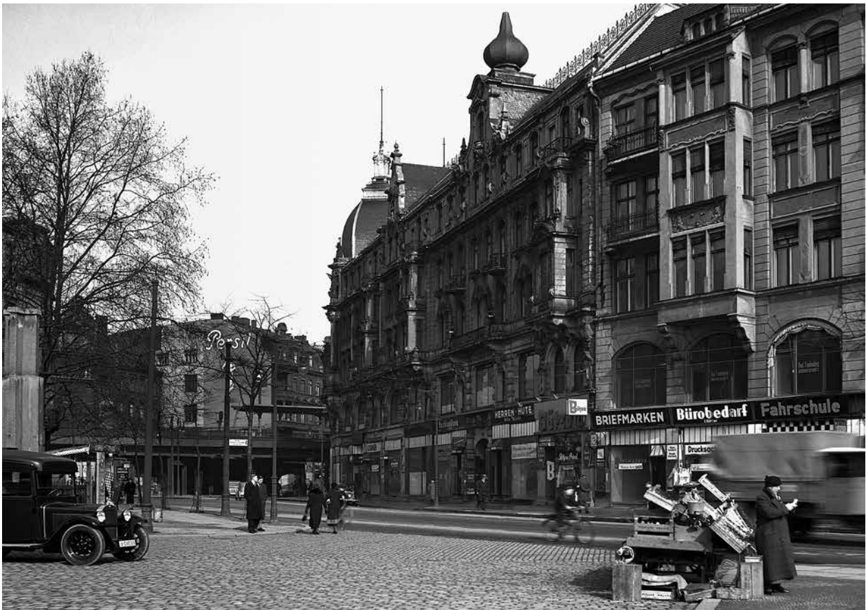
Blick auf die Burgstraße 28 (mit dem Türmchen, ab etwa 1940 Sitz des „Judenreferats“ der Stapoleitstelle Berlin) und die Nachbarhäuser, im Hintergrund der S-Bahnhof Börse (heute S-Bahnhof Hackescher Markt), Januar 1935

9. zum 10. November 1938 und verkündete, dass diese Ruine „für alle Zeiten“ als „eine Stätte der Mahnung“ so stehen bleiben sollte. „Alle Zeiten“ waren dann aber 1988 vorbei, dem Jahr, in dem der Wiederaufbau des vorderen Teils des Gebäudes beschlossen wurde.