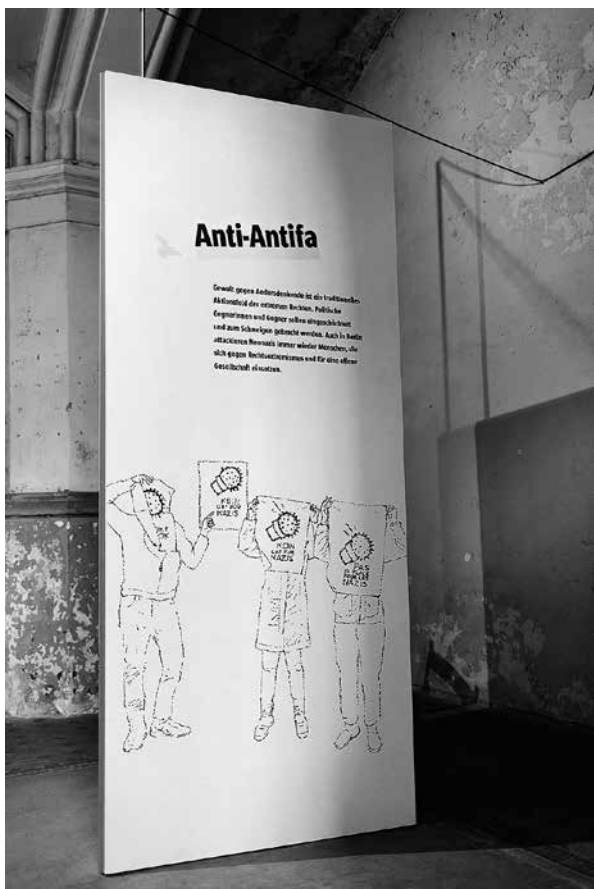
Blick in die Ausstellung in der Zionskirche

Ein Zwischenbericht zur Wanderausstellung