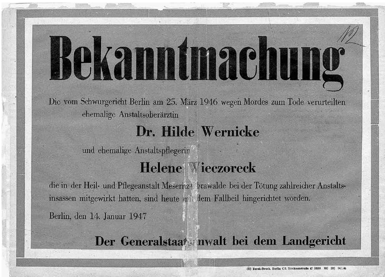
Öffentliche Bekanntmachung der Vollziehung der Todesstrafe gegen zwei an den Tötungen in Meseritz-Obrawalde beteiligte Täterinnen

Berlin liegen im Bestand „Hauptausschuss Opfer des Faschismus“ zahlreiche Korrespondenzen von Überlebenden und Angehörigen von Opfern der Anstalt mit OdF-Ausschüssen vor. Neben der Möglichkeit, darin Daten zu Opfern zu erheben, ist noch ein anderer Aspekt interessant: Um Zugang zu Entschädigungen und Privilegien zu erhalten, bemühten sich nahezu alle Antragsteller darum, sich als politisch verfolgt darzustellen. So findet sich in vielen Schreiben die Angabe, dass Meseritz ein Konzentrationslager gewesen sei oder dass dort zumindest „KZ-ähnliche“ Zustände geherrscht hätten. Der spezifische Verfolgungsgrund wurde so heruntergespielt, Tabuisierungen und Mythenbildungen begannen bereits sehr früh nach 1945. Im Bestand R 179 des Bundesarchivs, der etwa 30.000 Akten von Opfern der „Aktion T4“ umfasst, finden sich 240 Akten von Patientinnen und Patienten, die in Meseritz waren