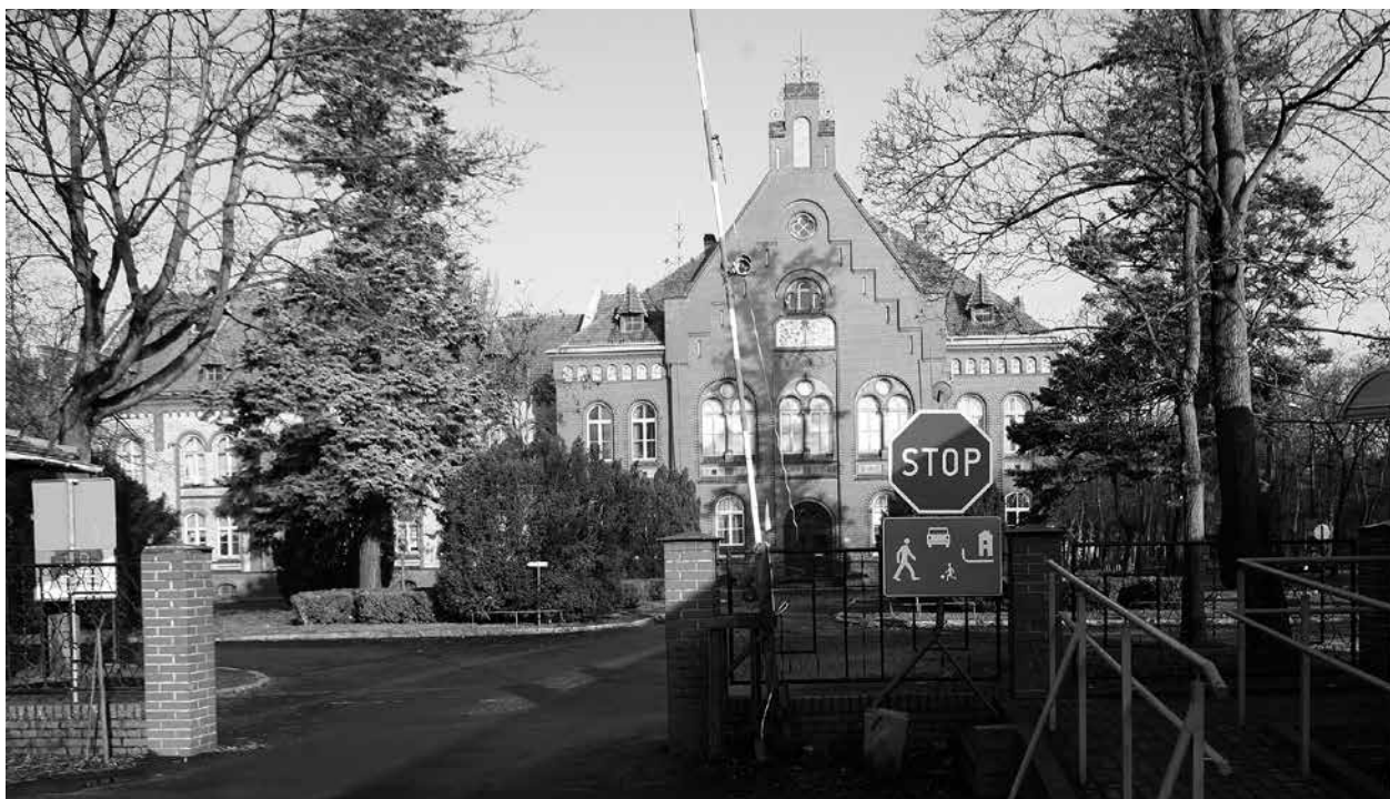
Eingang zum Psychiatrischen Krankenhaus in Międzyrzecz-Obrzyce, 2018.

Die „Provincial-Irrenanstalt Obrawalde bei Meseritz“ wurde 1904 als vierte derartige Einrichtung der Provinz Posen eröffnet. Damit ist sie ein Beispiel für die in Preußen typische Art der Fürsorge für „Geisteskranke“, die den selbst verwalteten Provinzialverbänden oblag. Die Anstalt lag – und liegt nach wie vor – auf dem 114 Hektar großen Gelände eines ehemaligen Gutes etwas außerhalb der Stadt. 1922 kam sie im Zuge der Umorganisation der preußischen Ostprovinzen nach den durch den Versailler Vertrag bestimmten Gebietsabtretungen an Polen zur neu geschaffenen Provinz „Grenzmark Posen-Westpreußen“. Da sie für diese Provinz als rein psychiatrisches Krankenhaus überdimensioniert war, kamen andere medizinische Abteilungen hinzu. 1938 wurde die Provinz aufgelöst. Meseritz kam territorial zu Brandenburg, die Anstalt wurde jedoch administrativ dem Provinzialverband Pommern zugeschlagen.