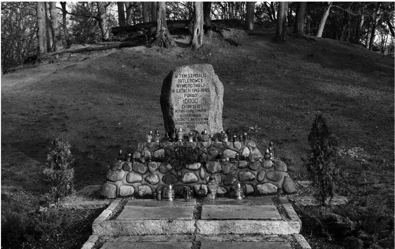
Gedenkstein auf dem Anstaltsgelände. Die Inschrift lautet auf Deutsch: „In diesem Krankenhaus ermordeten die Hitleristen 1942-1945 über 10.000 Kranke verschiedener Nationalitäten. Die Menschheit wird diese Verbrechen nicht vergessen. Meseritz-Obrawalde 1966“

schen Institution dargelegtes wissenschaftliches Interesse nachzuweisen. In der Praxis der Archivnutzung durch unabhängige Forschende oder Initiativen tun sich dadurch sehr große Hürden auf, die momentan nur teilweise durch intensive vorherige Korrespondenz und umfassende Zusicherungen, dass erhobene Informationen nur anonymisiert verarbeitet werden, umgangen werden können.