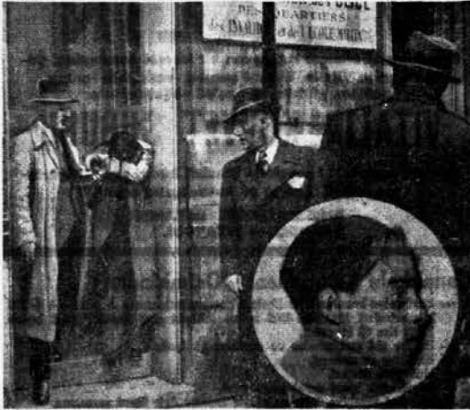
Katil Polonyalı Yahudi, polis komiserliğinden çıkarken fotoğrafçılarından yüzünü gizliyor. (Yuvarlakta: Bir portret)

Von Raht'ın ölümü üzerine Yahudi evlerinin camları kırıldı mağazalar tahrib edildi