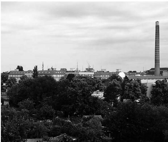
Blick auf das Gelände des ehemaligen KZ-Außenlagers, aufgenommen aus der Wohnung des Verfassers. Im Hintergrund die Fabrikgebäude der ehemaligen „Nationalen Krupp Registrierkassen GmbH“ (NCR).