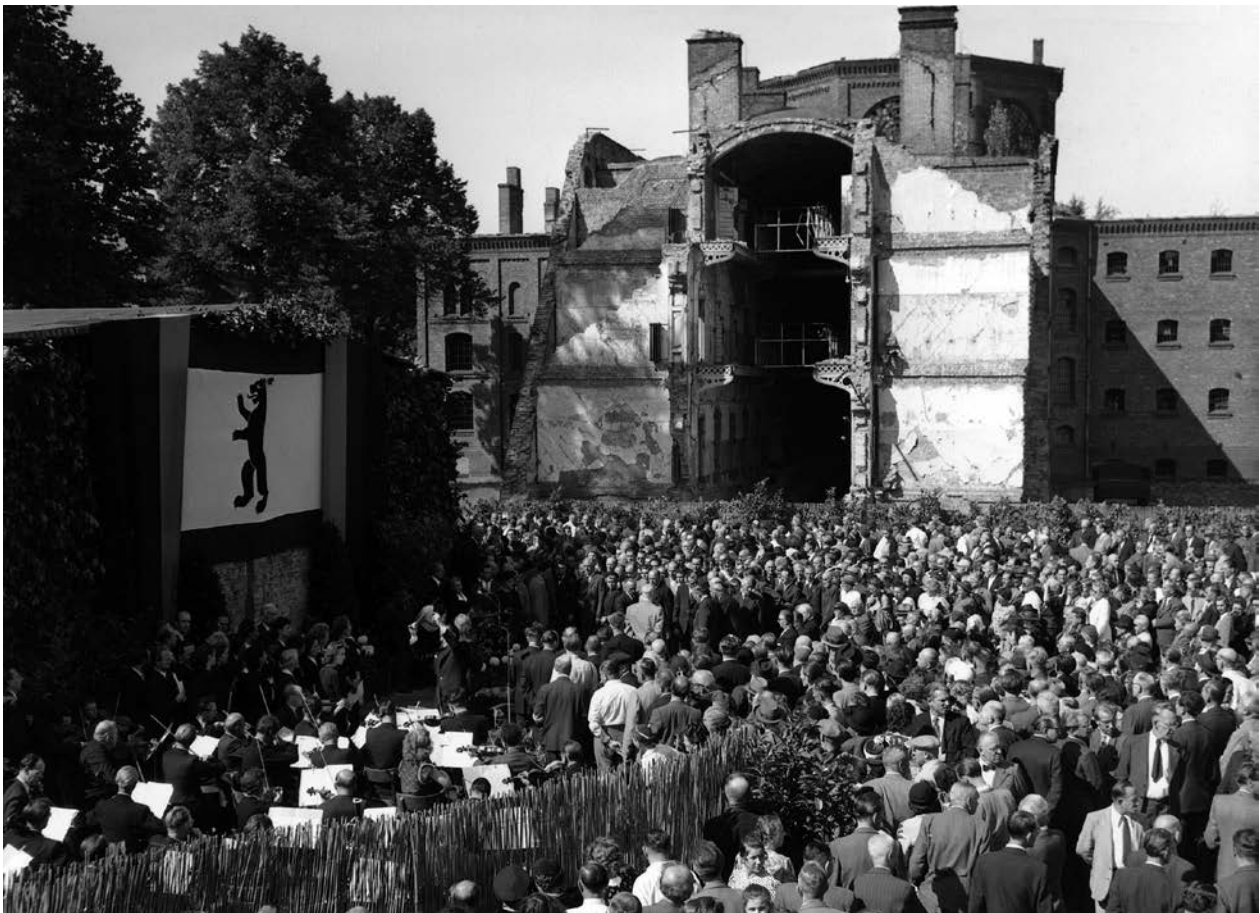
Gedenkfeier am ehemaligen Hinrichtungsschuppen des Strafgefängnisses Plötzensee mit Grundsteinlegung, 10. September 1951. Im Hintergrund das zerstörte Haus III, in dem die zum Tode Verurteilten inhaftiert waren.

Faschismus“ stand ganz unter diesen Vorzeichen: Überlebende verschiedener Widerstandsgruppen hoben auf der Veranstaltung die weltanschauliche Vielfalt der deutschen Widerstandsbewegung hervor, und auch über die „Rote Kapelle“ wurde berichtet. Noch Jahrzehnte später erinnerte sich Heinrich Scheel, der zum Kreis der „Roten Kapelle“ gehört hatte, an die Veranstaltung: „Niemand hielt dort eine gestanzte Rede, sondern Teilnehmer gedachten ihrer Mitstreiter, die im Widerstand den Tod gefunden hatten. Die Vielgestaltigkeit dieses Kampfes mit seinen unterschiedlichen Motivierungen wurde dabei ebenso eindrucksvoll bestätigt wie das aus ihm erwachsene Zusammengehörigkeitsgefühl, das mich ermutigte, in diese Trümmerwelt die Gewissheit zu tragen, nunmehr einer glücklicheren Zukunft entgegenzugehen.“ 2 Die von Scheel beschworene Solida-