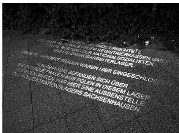
Lichtinstallation zum Gedenken an das ehemalige KZ

Das dynamische Spiel aus Aufscheinen, Bewegung und Verschwinden findet bei den Vorbeigehenden Beachtung. Ein etwa 10-Jähriger bleibt stehen, wendet sich an