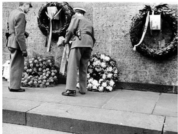
Polizisten entfernen die Schleifen von Kränzen an der Gedenkmauer in Plötzensee, 7. September 1963

Im Jahr 1966 nahm der Senat schließlich Abstand vom generellen Entfernen östlicher Schleifen. Dies sollte nur dann noch erfolgen, wenn sie von verbotenen Organisationen oder von offiziellen Trägern des „SBZ-Regimes“ stammten. Auch sollten sie beseitigt werden, wenn ihr Text die „freiheitlich-demokratische Grundordnung der Bundesrepublik grob verunglimpfen“ würde. Nach diesen Vorgaben wurde im September 1967 noch ein Kranz des Zentralrates der Freien Deutschen Jugend (FDJ) entfernt, weil seine Schleifen Embleme der DDR trugen. Die übrigen Blumengebinde der FDJ, die ja auch in West-Berlin zugelassen war, wurden nicht beanstandet. Danach schienen sich alle Beteiligten mit den Vorgaben abgefunden zu haben; zumindest gab es keine weiteren Nachrichten zu Schleifen-Entfernungen. Erst in den 1970er-Jahren wurde dann unter Auflagen das Zeigen von DDR-Symbolen ebenfalls möglich.