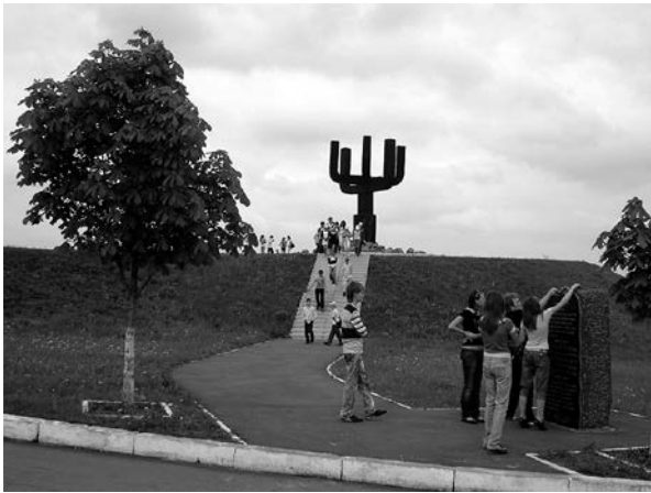
Die schwarze Menoraplastik „Baum des Lebens“