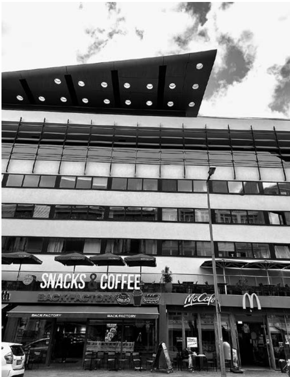
An der Stelle des Hauses, in dem sich die „Hannemannsche Buchhandlung“ befand, wurde im Rahmen der Internationalen Bauausstellung 1987 dieses Gebäude errichtet.