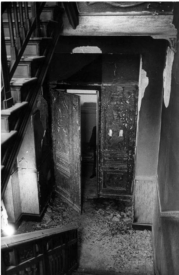
Brandspuren am Eingang zum Büro der Jüdischen Gemeinde nach dem Anschlag in der Joachimsthaler Straße, 9. Juli 1966

durch rechtsextreme Publikationen verwiesen, allen voran die „Deutsche National- und Soldatenzeitung“, die eindeutig antisemitische Tendenzen aufwies. Auf einige „haarsträubende Beispiele“ ihres neonazistischen Vokabulars verwies auf der Veranstaltung der Historiker und Publizist Joseph Wulf. Überdies machte er auf mehrere neonazistische Jugend- und Studentenzeitungen aufmerksam, die jüngst in Erscheinung getreten waren. Das Eintreten von Wulf gegen extrem rechte Akteure fand prompt eine Antwort, als er 1966/67 in West-Berlin ein „Internationales Dokumentationszentrum zur Erforschung des Nationalsozialismus und seiner Folgerscheinungen“ einzurichten versuchte. Als Standort sollte die Villa dienen, in der am 20. Januar 1942 die sogenannte „Wannsee-Konferenz“ stattgefunden hatte. Die Nationalzeitung hetzte von Beginn an gegen das