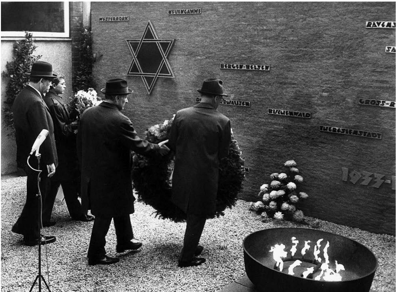
Kranzniederlegung an der Gedenkmauer des Jüdischen Gemeindehauses mit Angehörigen der Paul-Natorp-Schule und dem Regierenden Bürgermeister Klaus Schütz, 9. November 1969

veranstaltet. Stunden später wurden an den eingangs erwähnten Denkmälern in Steglitz und Schöneberg ähnliche Schriftzüge festgestellt. Das Mahnmahl in Charlottenburg wurde schnell gereinigt, stand doch am Mittag eine Gedenkstunde des BVN zum Jahrestag der Novemberpogrome an. Als sich die Mitglieder um zwölf Uhr auf dem Steinplatz versammelten, waren von den Schriftzügen kaum mehr als ein paar Schatten erkennbar. Kurz zuvor hatte der BVN-Geschäftsführer Max Köhler an der Veranstaltung der Arbeitsgemeinschaft der Verfolgtenverbände im Jüdischen Gemeindehaus teilgenommen. Als Vertreter des Senates sprach dort der Regierende Bürgermeister Klaus Schütz. Heinz Galinski konnte zudem Schüler*innen der Paul-Natorp-Schule begrüßen. Schon zu diesem Zeitpunkt dürften die meisten der Anwesenden über die nächtlichen Attacken