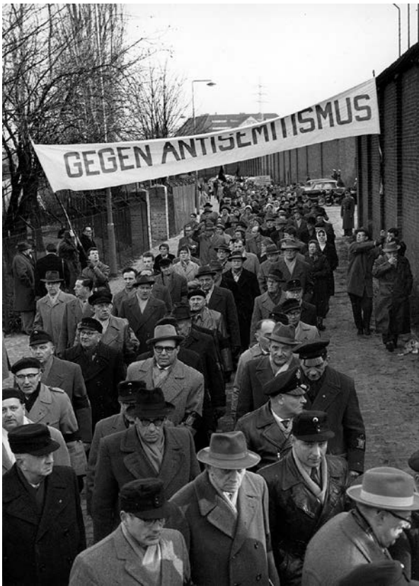
Protestmarsch gegen Antisemitismus zur Gedenkstätte Plötzensee, 30. Januar 1960

Die „Hakenkreuzschmierwelle“ von 1959/60 hatte eine neue Entwicklung offenbart: Eine jüngere Generation von Neonazis trat in Aktion. Sie waren nach dem Ende des „Dritten Reiches“ aufgewachsen und strebten nun nach Taten. Trotz einiger Verhaftungen und dem Verbot einzelner Organisationen blieben viele von ihnen dem extrem rechten Milieu verbunden. Weiterhin gab es Anschläge auf Denkmäler und Angriffe auf Personen. Eine der frühen Attacken galt im August 1963 dem Jüdischen Gemeindehaus in Berlin-Charlottenburg, dessen Türen von Unbekannten mit mehreren Nazi-Plakaten beklebt wurden. Heinz Galinski, der Vorsitzende der Jüdischen Gemeinde, sah diese Vorgänge mit großem Ernst. Zum 25. Jahrestag der Novemberpogrome warnte er vor neuen Neonazi-Aktivitäten und brandmarkte die Versuche der Verfälschung des Geschichtsbildes durch die rechtsradikale Presse. Galinski nahm in diesen Tagen auch an der Enthüllung eines Denkmals teil, das am ehemaligen