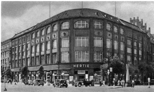
Kaufhaus Hertie in Berlin-Kreuzberg, Belle-Alliance-Straße 1-3