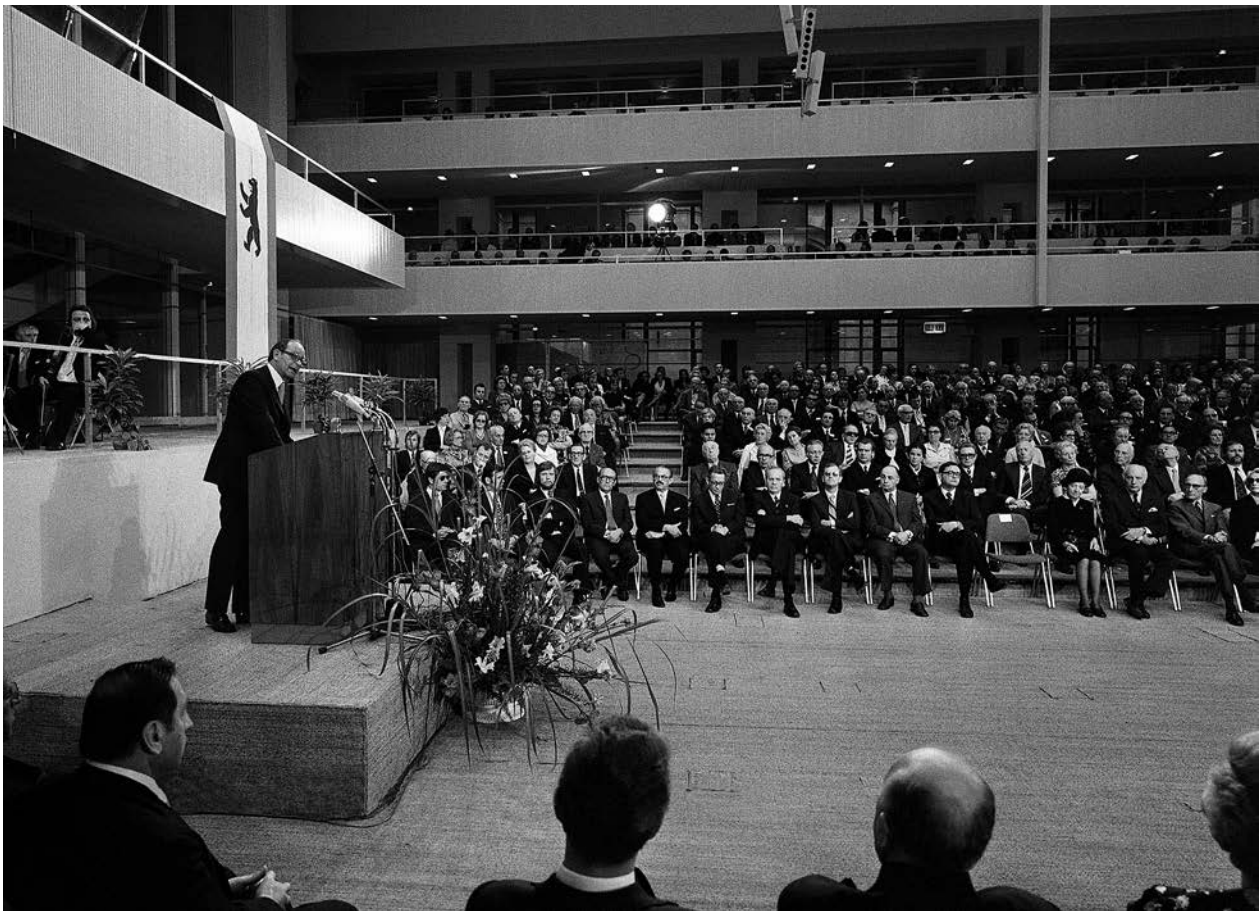
Ansprache von Hans Filbinger im Plenarsaal des Reichstages, 19. Juli 1974

Anfang 1974. Ursprünglich wollte der Senat den Bundespräsidenten und den Bundeskanzler für die Feier im Reichstag gewinnen, was auch die Stiftung „Hilfswerk 20. Juli 1944“ favorisierte. Das im Mai neu gewählte Staatsoberhaupt Walter Scheel lehnte eine Ansprache jedoch ab, Helmut Schmidt war wegen einer Gartenparty des Kanzleramtes in Bonn verhindert. Somit rückte der dritte Mann im Staat, Hans Filbinger, in den Fokus.