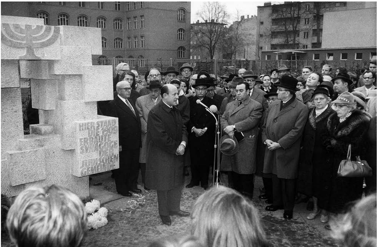
Heinz Galinski bei der Einweihung des Denkmals zur Erinnerung an die Synagoge in der Münchener Straße, 8. November 1963

der ersten Welle fünf Jahre zuvor. Dennoch war das Ausbleiben größerer zivilgesellschaftlicher Proteste erklärungsbedürftig. Neben einem Desinteresse der Politik schien eine Gewöhnung an Hakenkreuze im öffentlichen Raum stattgefunden zu haben. Die zunehmende Gleichgültigkeit zeigte sich auch darin, dass die Warnungen und Hinweise der Betroffenen nicht ernst genommen wurden.