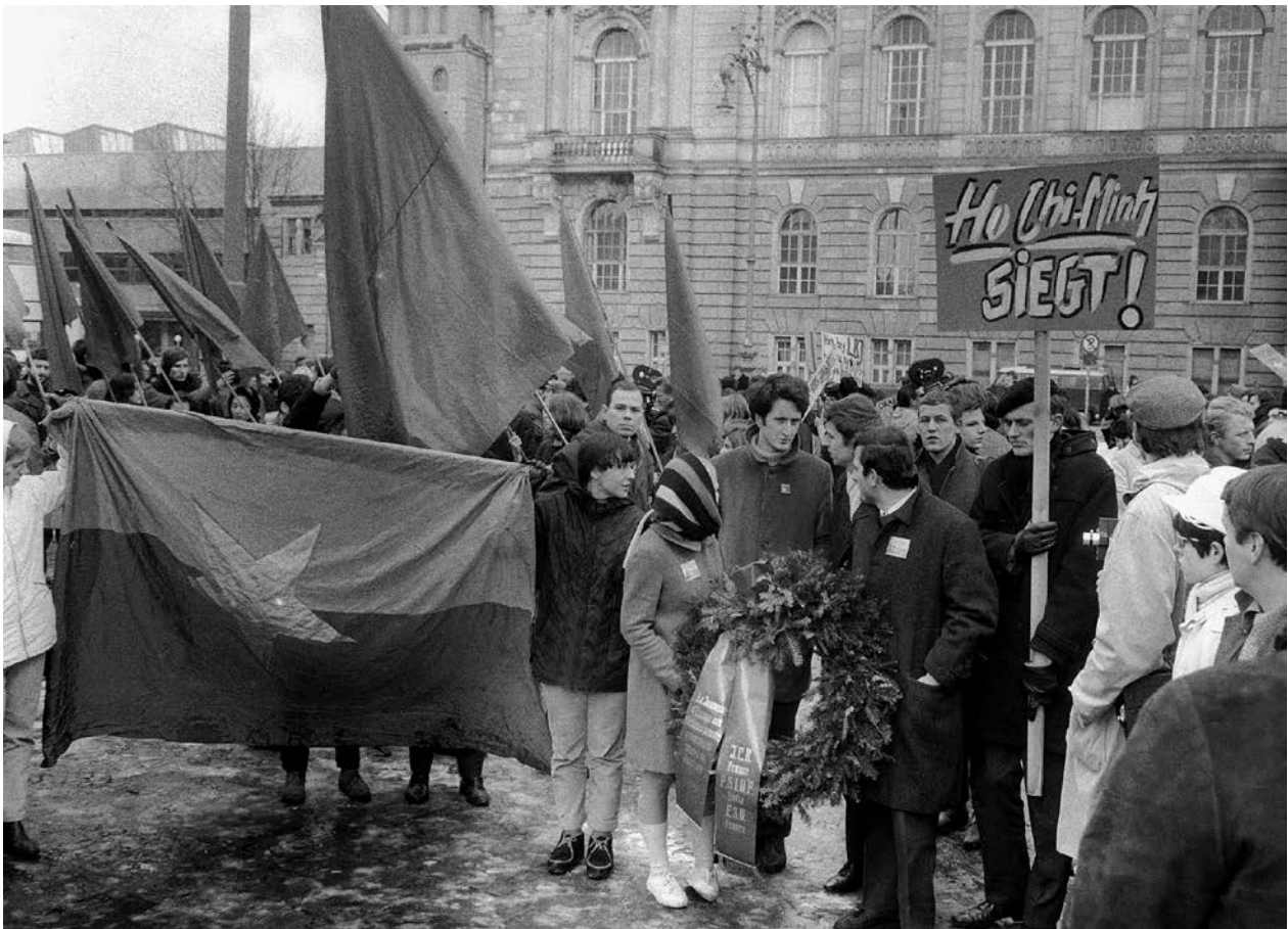
Kranzniederlegung von ausländischen Delegationen des Vietnam-Kongresses am Mahnmal auf dem Steinplatz, 18. Februar 1968

Das Haus der Wannsee-Konferenz verschwand 1967/68 wieder aus dem Blick der Öffentlichkeit. Im Fokus von Gewalt und Solidarität blieben das Jüdische Gemeindehaus und das Mahnmal auf dem Steinplatz. Der Problematik von Rechtsradikalismus und Antisemitismus sowie der Hetze der National- und Soldatenzeitung war sich der Senat zwar durchaus bewusst. Den verunsicherten Verfolgtenverbänden bekräftigte der Regierende Bürgermeister Klaus Schütz jedoch: „Es ist meine feste Überzeugung, die deutsche Demokratie ist stark genug, um mit dem Radikalismus und Extremismus von wo auch immer fertig zu werden.“ Damit bezog sich Schütz auf die jüngsten Ereignisse in der Stadt. Der Vietnamkrieg hatte auch in West-Berlin heftige Proteste hervorgerufen, und nach dem Tod von Benno Ohnesorg bei einer Demonstration gegen den Schahbesuch am 2. Juni 1967 hatte es gewaltsame Unruhen gegeben.