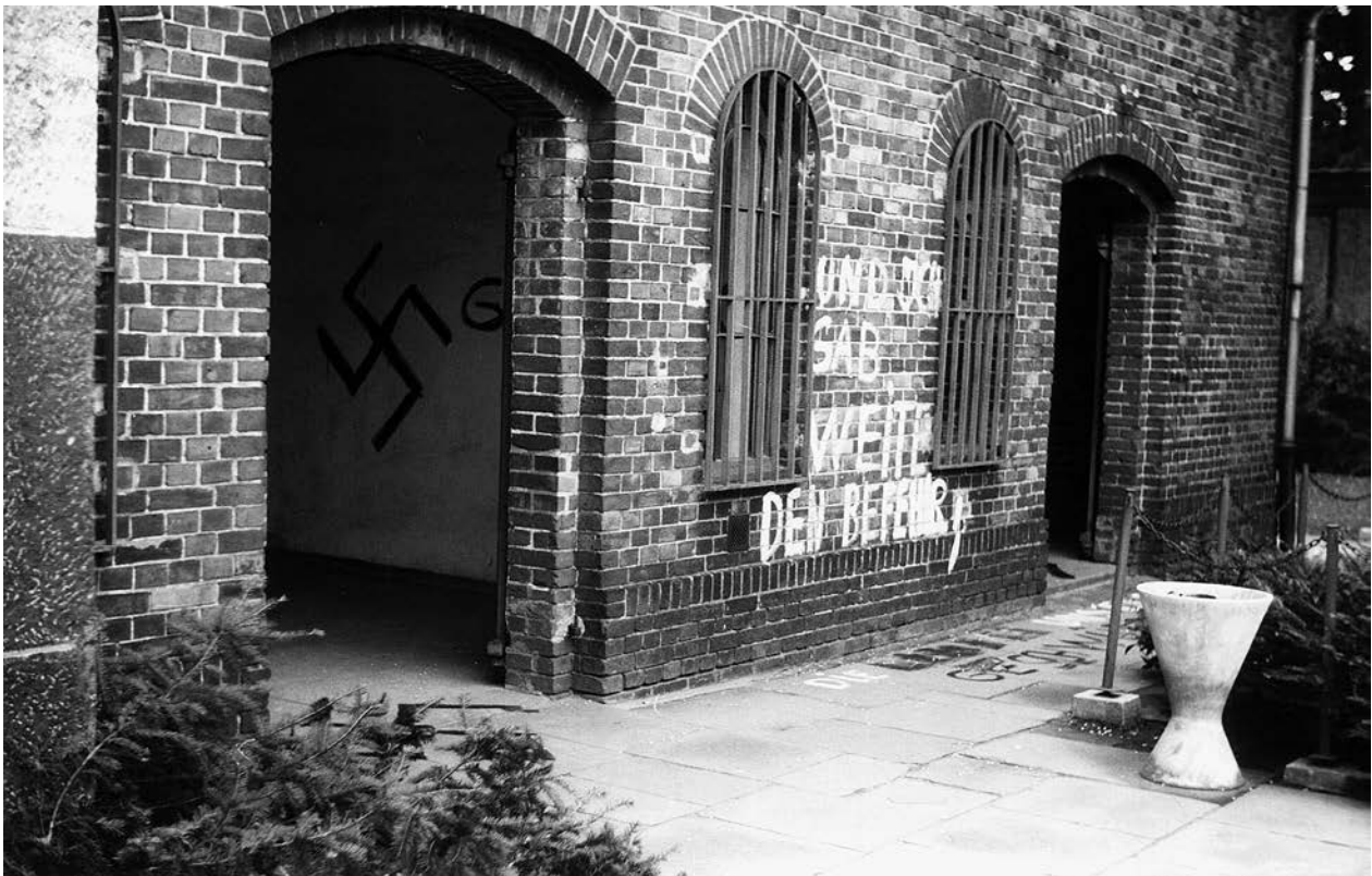
Der mit dem Hitler-Zitat beschmierte ehemalige Hinrichtungsschuppen in der Gedenkstätte Plötzensee. Im Inneren sind weitere Drohungen erkennbar, 20. Juli 1969

Politik und zivilgesellschaftliche Organisationen verurteilten die Anschläge aufs Schärfste. Die Gewerkschaft IG Metall warnte in ihrer Zeitung „Berliner, wacht auf! Die Nazis sind da!“, und der DGB setzte eine Belohnung von 2.000 DM zur Ergreifung der Täter*innen aus. Selbst Bundespräsident Gustav Heinemann, der am 20. Juli noch in Plötzensee gesprochen hatte, meldete sich zu Wort. Auch die Abendnachrichten des SFB berichteten. Die Öffentlichkeit war informiert – größere Solidaritätsaktionen oder Demonstrationen blieben allerdings aus. Fast schon hilflos liest sich das Protest-Telegramm, das die Arbeitsgemeinschaft der Verfolgtenverbände nach dem Anschlag an Klaus Schütz sandte: Mit tiefer Abscheu habe sie von der Schändung der Gedenkstätte Plötzensee erfahren, nachdem „in unserer Stadt schon wiederholt antisemitische Brandstiftungen und Schmierereien vorgekommen“ seien, laute es darin. Die Nationalzeitung nutzte unterdessen die Gelegenheit, um mit vorgetäuschter Empö-